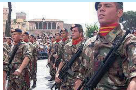
Motorisma infanteriet Brigad